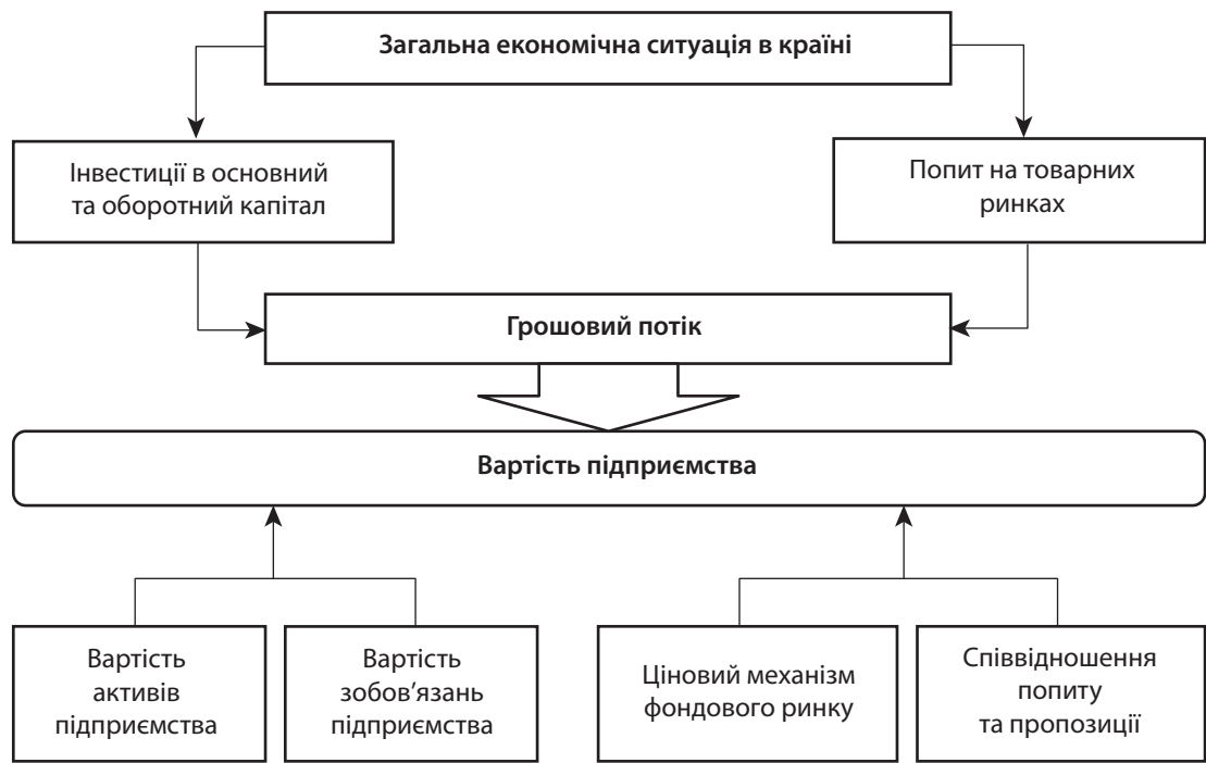
Рис. 3. Система факторів вартості підприємства [10]

Певним удосконаленням розробок П. Ю. Старюка, який розглядав три групи фундаментальних факторів вартості – операційної, інвестиційної та фінансової ефективності, можна вважати підхід, запропонований З. О. Ковалем [6], відповідно до якого дослідження вартісно-орієнтованого управління здійснюється в розрізі трьох груп факторів, а саме: фінансової ефективності (прибуток, дохід на акцію), ресурсної (організаційної) ефективності (співвідношення обсягів діяльності та використаних ресурсів) і соціальної ефективності (соціальна відповідальність, рівень задоволення потреб споживачів).