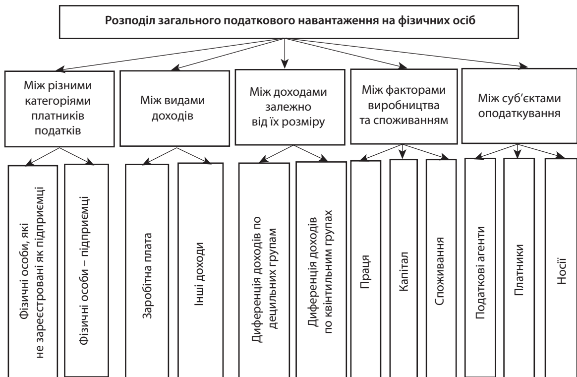
Рис. 1. Розподіл загального податкового навантаження на фізичних осіб

діяльності та незалежної професійної діяльності; податок на доходи фізичних осіб від інших видів діяльності; фіксований податок на доходи фізичних осіб від зайняття підприємницькою діяльністю (до 2011 р.); податок на доходи фізичних осіб від продажу нерухомого майна та надання нерухомості в оренду (суборенду), житловий найм (піднайм); податок на доходи фізичних осіб від продажу рухомого майна та надання рухомого майна в оренду (суборенду); податок з власників наземних транспортних засобів та інших самохідних машин і механізмів (до 2011 р.); збір за першу реєстрацію транспортних засобів (з 2011 р.); плата за торговий патент на деякі види підприємницької діяльності, сплачений фізичними особами (до 2001 р.); збір за провадження деяких видів підприємницької діяльності, сплачений фізичними особами (з 2011 р.); ринковий збір, сплачений фізичними особами (до 2011 р.); збір за видачу дозволу на розміщення об'єктів торгівлі та сфери послуг, сплачений фізичними особам (до 2011 р.); плата за землю; збір за місця для паркування транспортних засобів; єдиний податок), млн грн;