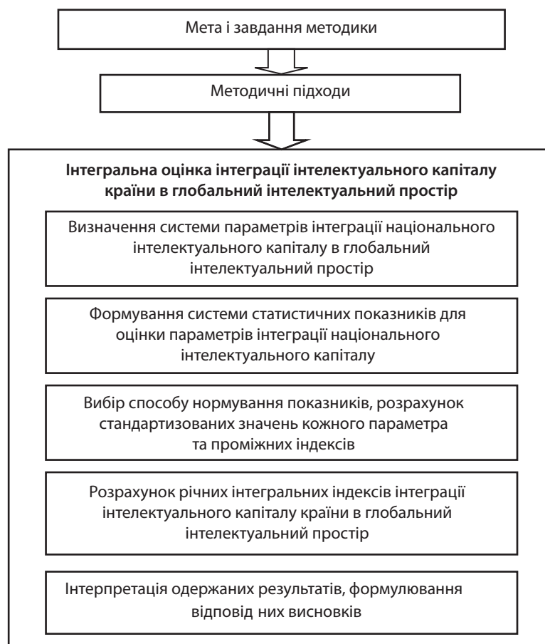
Рис. 4. Алгоритм розробки методики виміру рівня інтеграції національної складової глобального інтелектуального капіталу