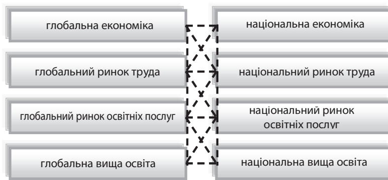
Рис. 3. Сучасні інституційні розриви в розвитку національної складової глобального інтелектуального капіталу

Для постійного моніторингу і контролю відповідних перетворень актуалізується проблема оцінювання міри інтеграції національної складової інтелектуального капіталу в глобальне середовище. Найчастіше для такої оцінки використовують окремі показники міжнародної діяльності наукових організацій, закладів вищої освіти тощо, що не враховує цілісності та системності інтелектуального капіталу.