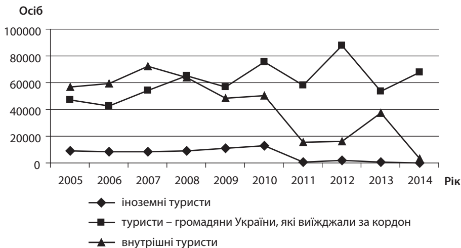
Рис. 1. Динаміка туристичних потоків в Україні

Однією з причин цього явища є недостатньо ефективна загальна система дослідження, моніторингу та управління ринку туристичних послуг, яка недостатньо ефективно діє в інформаційній сфері та у сфері управління туристичним ринком.