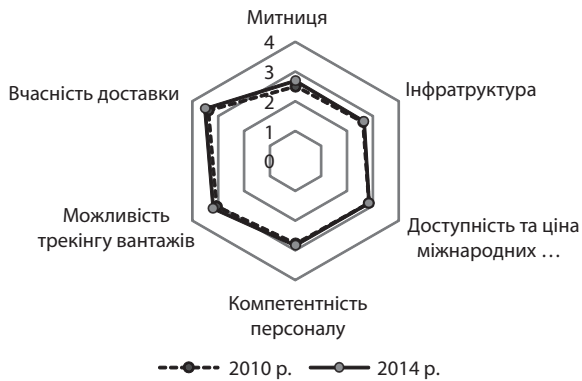
Рис. 3. Ефективність логістики в Україні, 2010–2014 рр.

зволяє створювати ефективні транспортні мережі. Суттєвого вдосконалення потребує діяльність транспортних операторів та митних брокерів, адже низька якість їхніх послуг негативно впливає на ефективність процесу відстеження вантажу та вчасної його доставки до пункту призначення [2]. На рис. 3 наведені складові індексу ефективності логістики в Україні та їх оцінка.