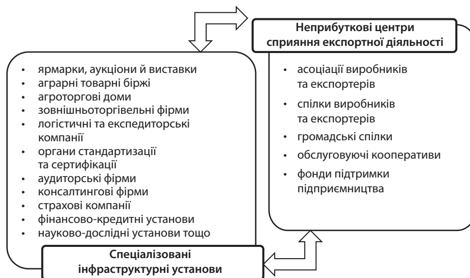
Рис. 2. Основні елементи інфраструктури експортної діяльності аграрного сектора

Важливим елементом експортної діяльності є логістика та транспортна інфраструктура. На глобальному рівні якість транспортної інфраструктури оцінюється за допомогою Індексу ефективності логістики, який включає ефективність митної адміністрації, якість інфраструктури та своєчасність відвантаження товару і розраховується у межах від 0 до 5. Згідно звіту МБРР «Connecting to Compete 2014» [16] Україна за даною оцінкою зайняла 61 місце у рейтингу з індексом 2,95 серед 160 країн та знаходиться у топ-10 нижче середнього. Проблемним є відставання від країн-лідерів за якістю портів, залізничного сполучення, автошляхів, масштабами використання інформаційних технологій, що до-