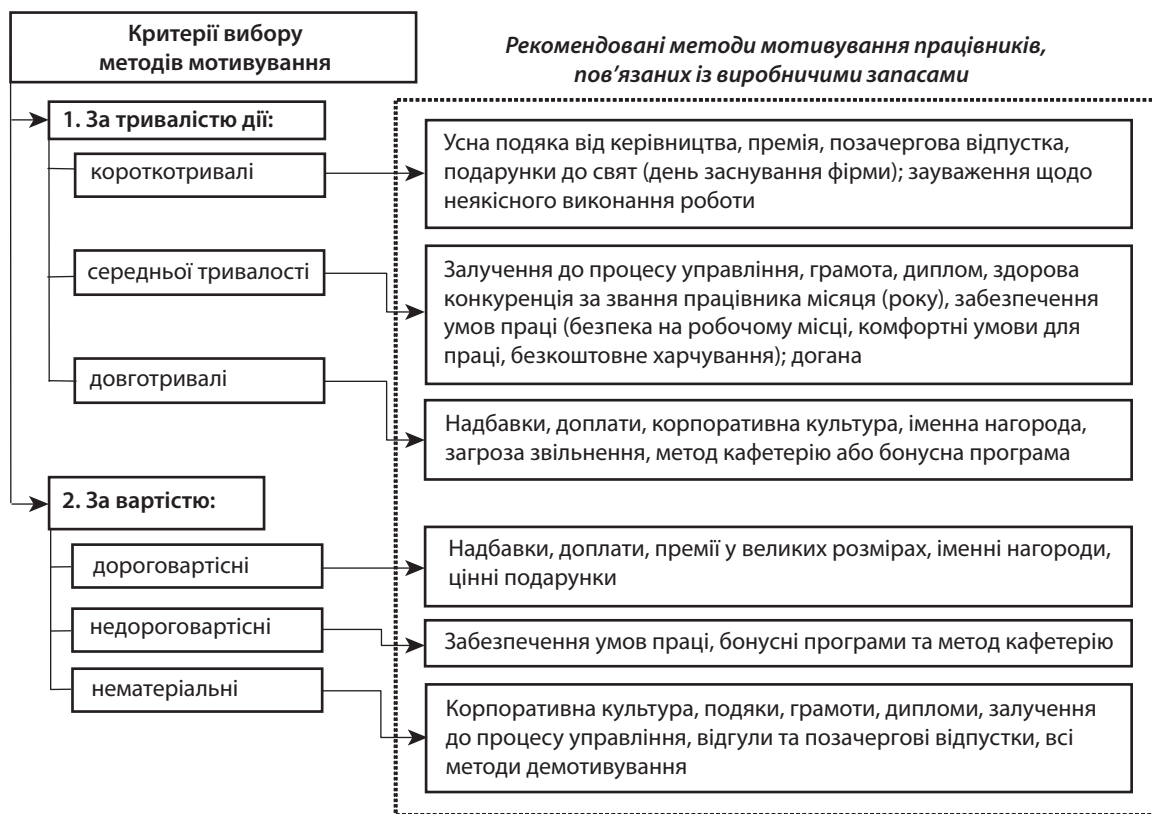
Рис. 2. Модель вибору методів мотивування працівників, пов'язаних із виробничими запасами