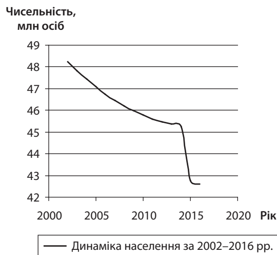
Рис. 2. Динаміка скорочення населення в Україні за 2002–2016 рр.

Для більшої наочності зміни в чисельності населення України за період 2002–2016 рр. наведено на рис. 2.