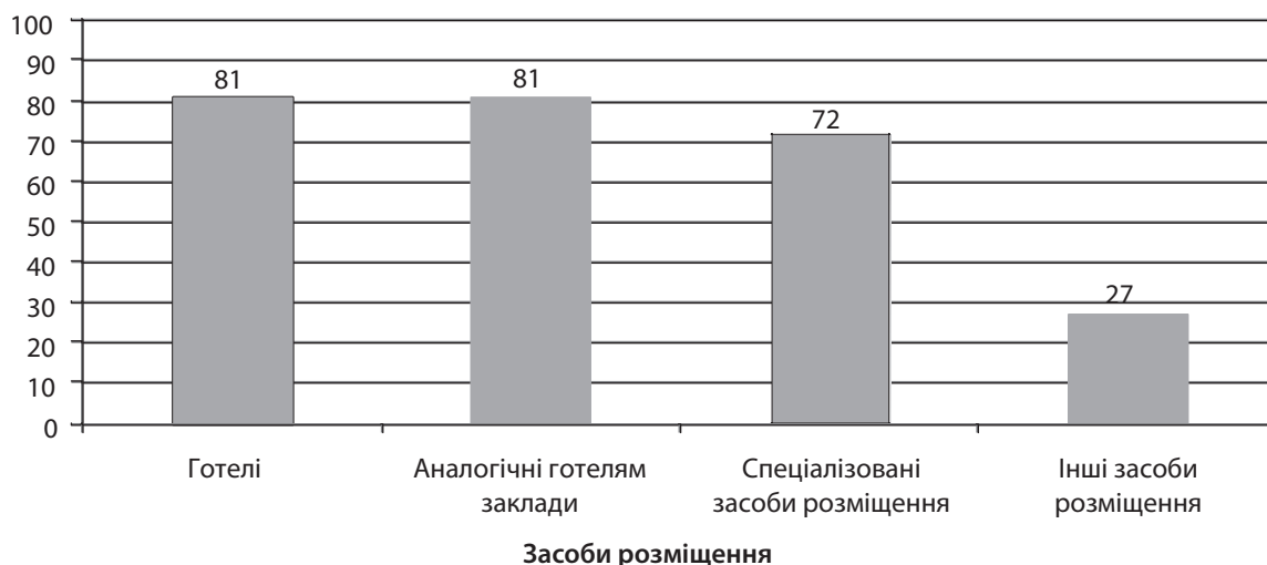
Рис. 3. Рівень доступності інфраструктури та послуг колективних засобів розміщення в Харківському регіоні для людей з особливими потребами, 2016–2017 рр.

та аналогічні готелям засоби розміщення виявилися найдоступнішими для розміщення людей з особливими потребами серед усіх досліджених закладів.