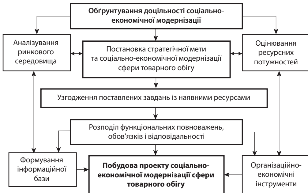
Рис. 1. Концептуальна схема соціально-економічної модернізації сфери товарного обігу