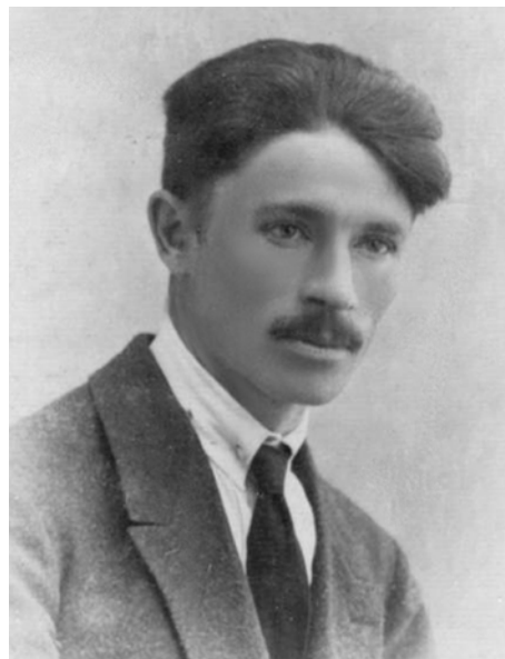
Фото ліворуч: В.І. Вернадський – засновник і голова Полтавського товариства любителів природи. Фото праворуч: В.Ф. Ніколаєв – секретар товариства.