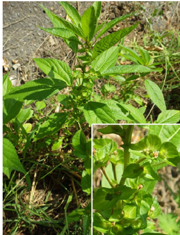
Рис. 1. L. в м. Ужгород: загальний вигляд рослини та фрагмент суцвіття. Fig. 1. Acalypha australis L. in the Uzhhorod: general view and fragment of inflorescence.

двох із них відмічено небагато, близько півтора десятка особин у кожному, переважно високих (близько 30–40 см заввишки), генеративних рослин, які ростуть під стінами технічної будівлі та адміністративного корпусу факультету й знаходяться під покривом високорослих інших видів адвентивних рослин, зокрема спонтанно занесених Phytolacca americana L., Ailanthus altissima (Mill.) Swingle та висаджених Thuja occidentalis L. тощо.