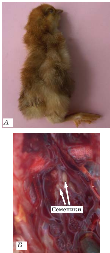
Рис. 2. А — цыпленок, соответствующий по окраске оперения самке, имел хорошо развитые семенники; Б — слабо развитые вторичные половые признаки у самцов, выведенных из яиц после продолжительного хранения

наблюдали 11 особей (23,4%) со слабо развитыми вторичными половыми признаками (рис. 2, Б).