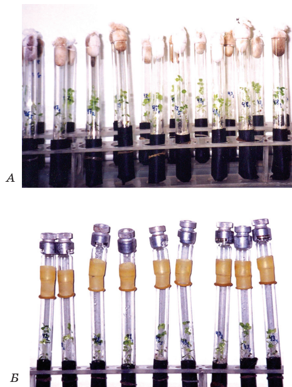
Рис. 1. Первинний скринінг Tn5-мутантів R. leguminosarum bv. trifolii за симбіотичними властивостями і Eff ++ -фенотипом рослин:

Статистичну обробку експериментальних даних виконували за Доспеховим [32] із застосуванням програми Microsoft Excel 2003. Для показника урожайності було використано показник НІР (найменша істотна різниця). У таблицях і на рисунках наведено середні арифметичні та їх стандартні похибки.