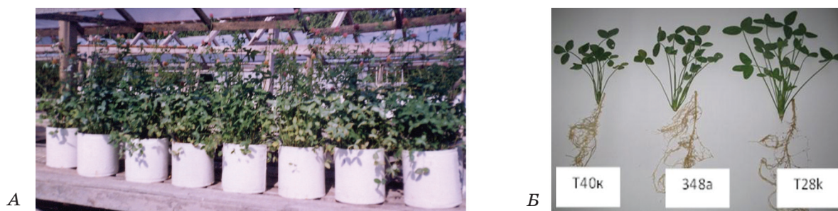
Рис. 2. Вплив інокуляції бульбочковими бактеріями на формування і функціонування симбіотичного апарату та ріст вегетативної маси (А, Б) рослин конюшини (вегетаційний дослід)

мутанта Т72к була більшою в 1,6 раза в ранній період функціонування симбіотичної системи — у фазі кущіння і в 2,4 раза — у фазі початку цвітіння конюшини порівняно з бульбочками, утвореними вихідним штамом 348а. Упродовж усього періоду вегетації рослин найбільшою інтенсивністю відновлення N_2 характеризувалися симбіотичні системи конюшини, утворені за участю Тn5-мутантів R. leguminosarum bv. trifolii Т28к та Т72к (табл. 5).