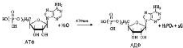
Рис. 1. Реакція розпаду АТФ

зумовлені сукупністю їхніх біологічних властивостей: хімічною інертністю, біосумісністю, відсутністю токсичності [8]. Ліпосоми здатні спрямовано доставляти біологічно активні речовини у потрібні органи і тканини організму.