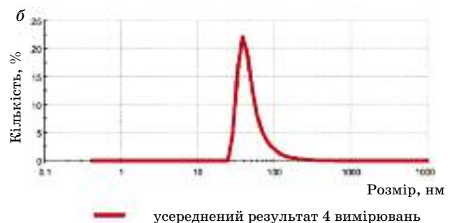
Рис. 3. Кількісний розподіл ліпосомної форми АТФ за розмірами