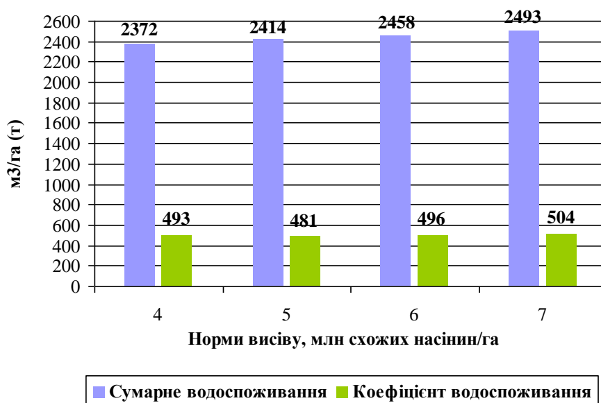
Рис. 2. Водоспоживання рослин ячменю озимого залежно від норми висіву насіння за сівби 25 вересня (середнє за 2007–2010 рр.)

У результаті досліджень виявлено вплив густоти стояння рослин на витрату посівами вологи. Так, в середньому за роки досліджень у варіанті з нормою висіву 4 млн схожих насінин/га був найменший рівень водоспоживання у рослин ячменю озимого – 2372 м 3 /га. Підвищення норми висіву до 7 млн схожих насінин/га призводило до збільшення сумарного водоспоживання посівів на 5,1 %, що становило 2493 м 3 /га (рис. 2).