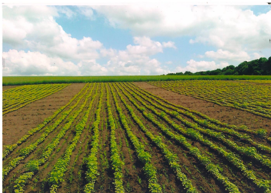
Рис. 1. Загальний вигляд дослідних ділянок.

Насіння обох культур висівали зерно-трав'яною сівалкою СЗТ-3,6 у першій декаді трав-ня. При цьому гречку сіяли широкорядним способом (ширина міжрядь 45 см), просо – зви-чайним рядковим (ширина міжрядь 15 см), розміщуючи рядки в міжряддях гречки (рис. 1).