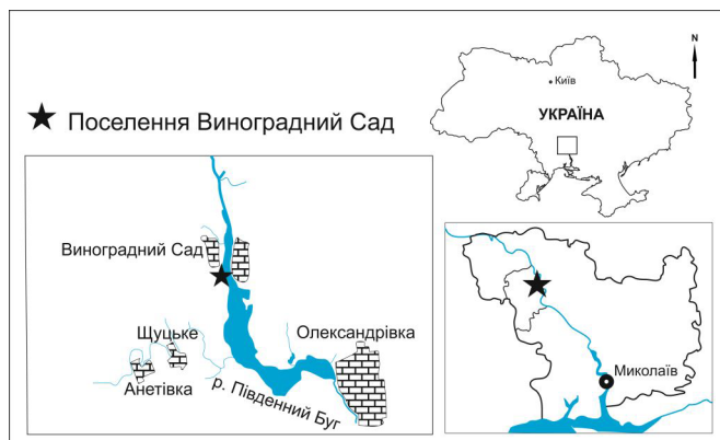
Рис. 1. Місце розташування поселення Виноградний Сад із рештками риб