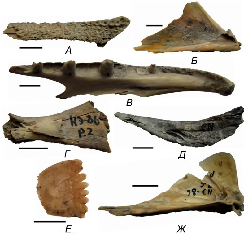
Рис. 4. Рештки щукових і окуневих риб із поселення Виноградний Сад. Esox lucius : А – palatinum; Б – articulare; В – dentale; Г – epihyale; Д – cleithrum. Perca fluviatilis : Е – луска. ? Gymnocephalus schraetser . Ж – quadratum