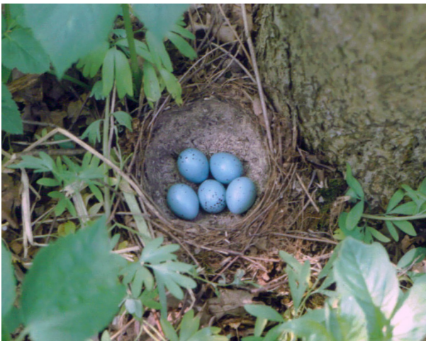
Рис. 3. Гніздування дрозда співочого Turdus philomelos (Brehm.) на землі

Comment: * – difference of reliability at p < 0.05 .