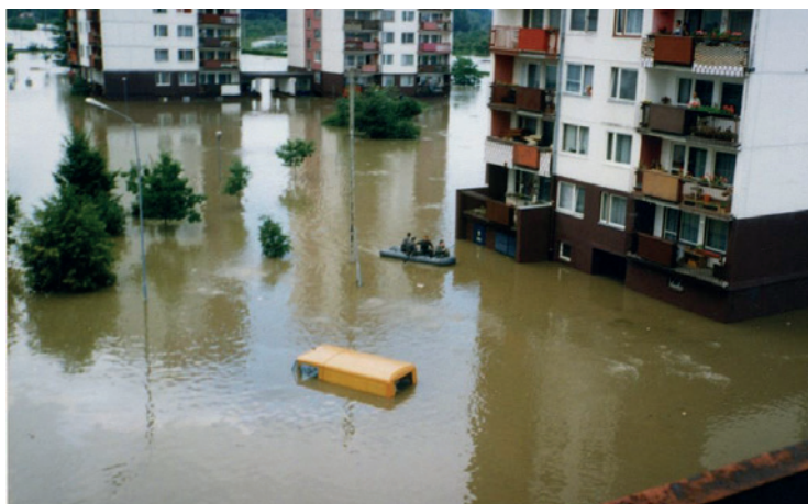
Rycina 3. Ludzie oczekujący na pomoc w trakcie powodzi w Opolu w 1997 r. [15]