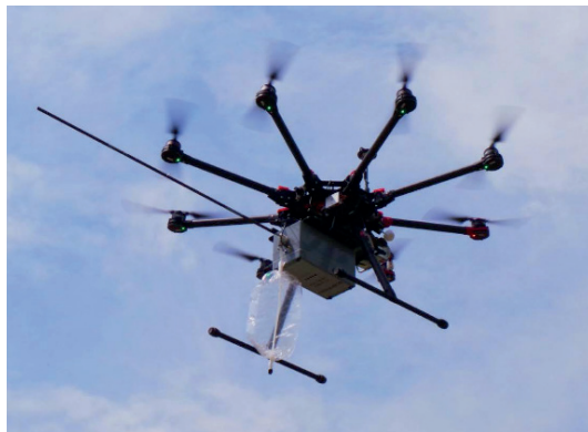
Rycina 4. Pojazd bezzałogowy DR 1000 posiadający możliwość poboru próbki powietrza oraz pomiaru stężenia takich związków jak np. \text{CH}_4 , \text{CO}_2 , \text{H}_2\text{S} , \text{SO}_2 , oraz ilości cząstek PM 1, 2,5 i 10 [16]

przez nie wyników w laboratorium. Na rycinie 4 został przedstawiony przykładowy widok takiego „latającego laboratorium”. Lanca pomiarowa na wielowirnikowcu została wysunięta poza obszar wpływu śmigieł, tak aby strugi powietrza wywołane pracą śmigieł nie powodowały zakłóceń pomiarowych.