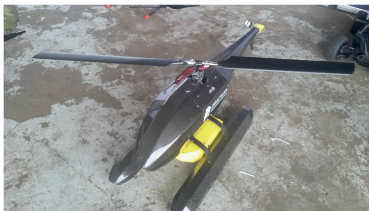
Rycina 6. Helidrone firmy Spartaqs z podczepioną tratwą ratowniczą. Czas lotu Helidrone wynosi 40 minut, zasięg to 2500 m, maksymalny pułap to 1500 m [20]

their leisure time at the seaside. A similar solution is currently being marketed by the Polish company Spartaqs in its Helidrone product. The Polish Drone Lab has also been working on a similar solution.