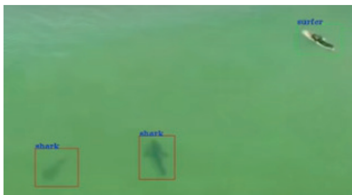
Rycina 5. Zdjęcie, na którym algorytm rozpoznał dwa obiekty jako rekiny i jeden obiekt jako surfera [19]

Kolejnym ciekawym zastosowaniem pojazdów bezzałogowych jest obserwacja wybrzeża w celu wykrywania rekinów i innych drapieżników oraz ostrzeganie przed nimi. (rycina 5). Takie rozwiązanie o nazwie „Little Ripper” ma zostać wprowadzone nad plażami w Australii [17, 18]. Bezzałogowy helikopter z kamerą, dzięki zastosowaniu algorytmów sztucznej inteligencji, jest w stanie wykryć rekina z 90% dokładnością i zasignalizować zaistniałe zagrożenie [18, 19]. W założeniu projekt ma na celu zredukowanie liczby osób zaatakowanych przez morskie drapieżniki.