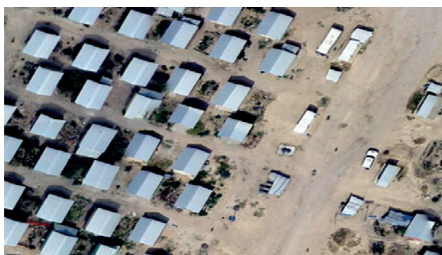
Rycina 2. Porównanie jakości zdjęć satelitarnych (po lewej), i zrobionych za pomocą pojazdu bezzałogowego (prawa strona) na przykładzie Tanzanii [13]

Figure 2. Comparison of the quality of satellite imagery (left) and images taken using an unmanned vehicle (right side) on the example of Tanzania [13]