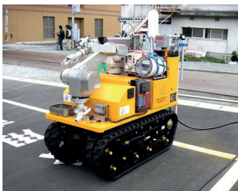
Rycina 7. Monirobo – japoński pojazd wykorzystany do pomocy w trakcie usuwania awarii elektrowni atomowej w Fukushima [23]

Structures of this type find very limited application in rescue operations, where the rescuer's life or health could be at risk. A good example can be the use of such robots in 2011 following the failure of the nuclear power plant in Fukushima, Japan. Equipped with sensors, the radiation-resistant Monirobo robots provided information on the condition of the structure and the consequences of the failure in places where radiation levels were too dangerous for people [21, 22].