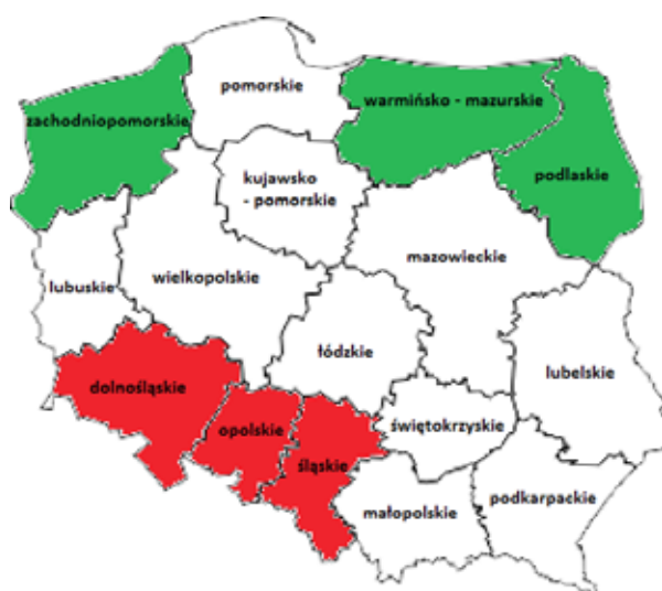
Rycina 1. Obszary najbardziej bezpieczne (kolor zielony) oraz najbardziej niebezpieczne (kolor czerwony) w Polsce

Taking into consideration the results of the analysis carried out, it can be noted that the lowest negative values of the developed indicator, confirming a high level of security, were reached by northern regions of our country (voivodeships: Zachodniopomorskie -4, Podlaskie -3, Warmińsko-Mazurskie -3). The southern areas of Poland recorded the highest values (voivodeships: Dolnośląskie 11 points, Śląskie 10 points, Opolskie 9 points), pointing to low security levels.