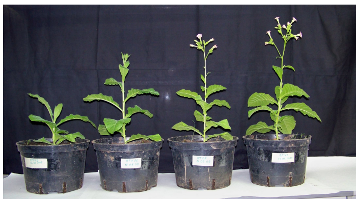
Рис. 1. Трансформовані рослини N. Tabacum (лінія BTV 11) T 2 покоління, адаптовані до умов вирощування у ґрунті

Вірус блютанга (BTV) належить до роду Orbivirus родини Reoviridae , що включає 24 різних серотипів BTV 1-24. Вірус блютанга має невеличкий (90 нм у діаметрі) ікосаедральний капсид, що містить сегментований геном з 10 сегментів дволанцюгової РНК. Кожен з сегментів кодує різні вірусні протеїни. Внутрішній шар капсиду складається з 5 структурних протеїнів: 3 мінорних (VP1, VP4, VP6) та 2 мажорних (VP3, VP7). Зовнішній шар капсиду складається з 2 мажорних вірусних протеїнів (VP2, VP5). При чому, саме VP2 антиген обумовлює серотипову різноманітність вірусу блютангу, а VP7 антиген, обумовлює серогрупову специфічність [1, 2]. Саме тому ми обрали VP7 як антиген для серологічної діагностики блютанга жуйних. У попередній роботі отримали трансгенні рослини тютюну, що експресують повноцінний рекомбінантний вірус-специфічний антиген VP7 (рис. 1). У роботі розробили діагностичну тест-систему «Блютанг-АТ» для серологічної діагностики блютанга жуйних.