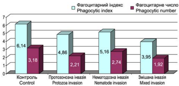
Рис. 1. Показники фагоцитарного індексу і фагоцитарного числа крові поросят, інвазованих нематодами, найпростішими та їх асоціацією (n=8)

Fig. 1. Indicators of phagocytic index and phagocytic number of piglets, infected with invasive nematodes, the protozoans and their association (n=8)