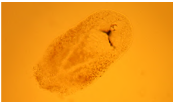
Рис. 2. Екцистований метацеркарій трематоди Cryptocotyle concava . Нативний препарат. Збільшення \times 280 Fig. 2. Excysted metacercaria of Cryptocotyle concava trematodes. Native. \times 280

фаринкс короткий — 0,011 мм, фаринкс овальний, 0,038 мм; за ним слідує розгалуження кишкової трубки, стовбури якого спрямовані до каудальної частини тіла та сліпо закінчуються позаду сім'яників. Статевий синус з рудиментарною червеною присоскою, округлої форми, розміщений у задній частині тіла. Екскреторний орган відкривається на кінці тіла (рис. 2).