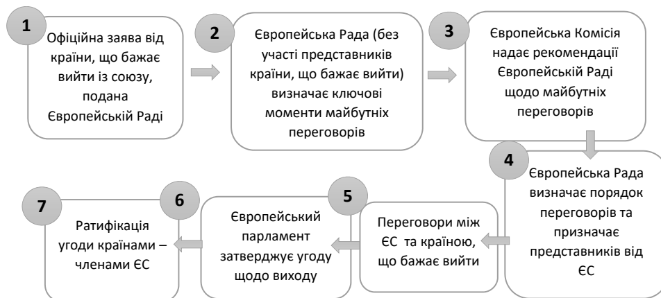
Рис. 2. Порядок створення та затвердження угоди щодо виходу країни з ЄС [13]

Загалом формальна процедура виходу має включати в себе декілька кроків, які наведено на рис. 2.