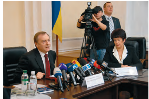
Прес-конференція Міністра юстиції 10 грудня 2010 року

День прав людини, 10 грудня, розпочався із прес-конференції Міністра юстиції України Олександра Лавриновича. У ході прес-конференції Міністр розповів представникам ЗМІ про заходи з нормативного забезпечення прав людини в Україні, що здійснюються Міністерством юстиції. Олександром Лавриновичем було презентовано перший номер журналу «Практика Європейського суду з прав людини. Рішення. Коментарі». За словами Міністра юстиції, вимога щодо опублікування українською мовою текстів Рішень Євросуду спеціалізованим видан-