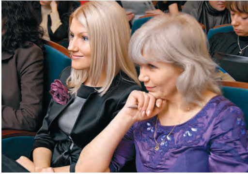
Під час проведення майстер-класів