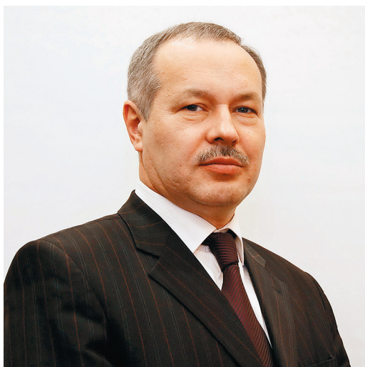
М. І. Цуркан

кандидат юридичних наук, заступник Голови Вищого адміністративного суду України