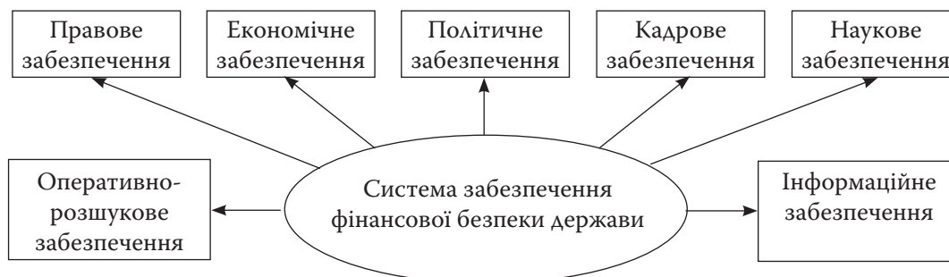
Рис. 1. Система забезпечення фінансової безпеки держави

Вважаємо, що запропоновані елементи входять до складу правового забезпечення. Разом з тим вчені не називають окремі елементи аналізованої системи, зокрема політичне та оперативно-розшукове забезпечення. Критично оцінивши підходи дослідників, вважаємо, що система забезпечення фінансової безпеки складається з таких елементів (рис. 1):