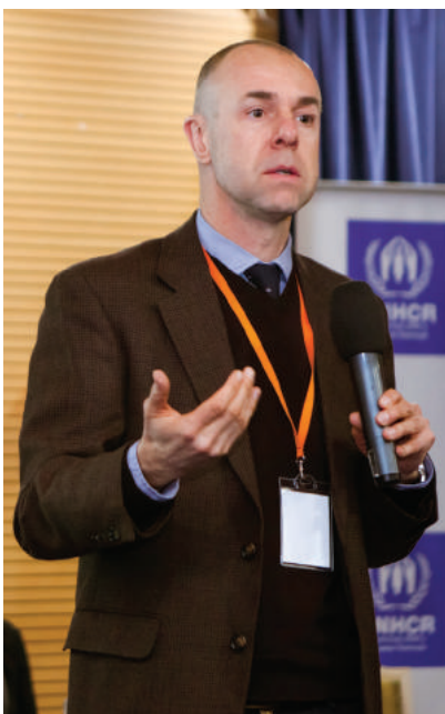
Директор представництва Норвезької ради у справах біженців в Україні Крістофер Меїлі

Так, 21 грудня 2016 року Верховна Рада України прийняла Закон України «Про Вищу раду правосуддя», яким було внесено зміни до Закону України «Про безоплатну правову допомогу» в частині розширення кола осіб,