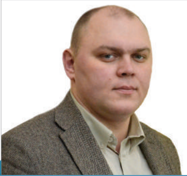
МОІСЕЄВ ЮРІЙ ОЛЕКСАНДРОВИЧ

Директор Департаменту з питань судової роботи та банкрутства Міністерства юстиції України