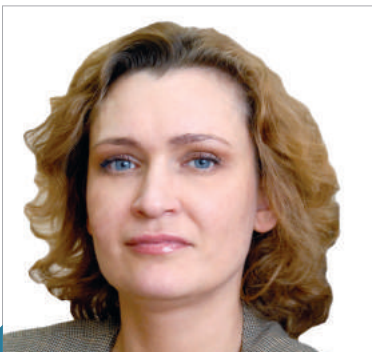
ДАВИДЧУК ОЛЬГА ВАСИЛІВНА

Перший заступник Міністра юстиції України