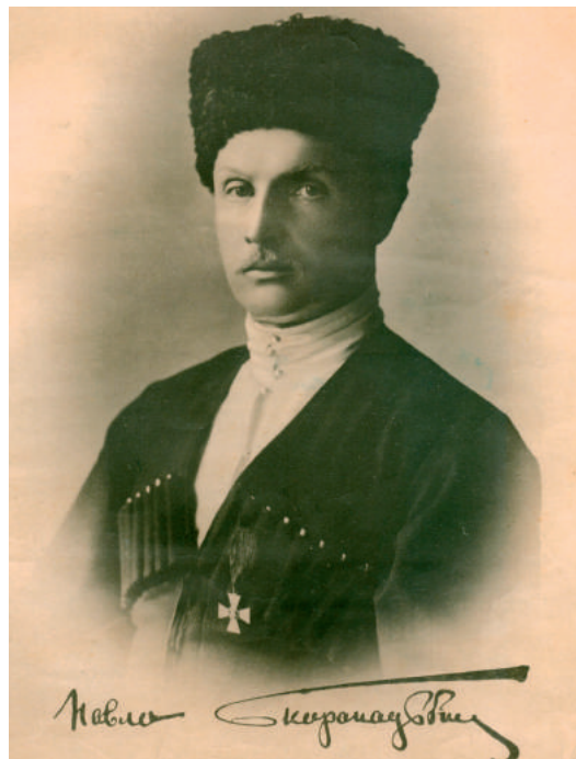
Павло Скоропадський Гетьман Всієї України

Міністерство юстиції у рамках святкування 100-річного ювілею української юстиції у приміщенні Музею «Будинок митрополита» Національного заповідника «Софія Київська» представило виставку архівних документів.