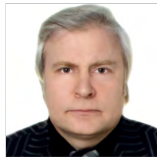
О. Л. Богиніч

завідувач відділом теорії держави і права Інституту держави і права ім. В. М. Корецького НАН України, доктор юридичних наук, професор, академік НАПрН України, заслужений юрист України