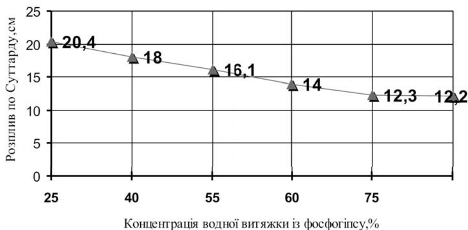
Рисунок 1 - Вплив хімічної активації витяжки із фосфогіпсу на рухливість будівельного розчину

Представлені результати експериментальних досліджень відображають позитивний вплив механо-хімічної активації ЗВ в технологічному процесі отримання ефективного заповнювача для виготовлення будівельних розчинів. В процесі механо-хімічної активації золи-виносу, вона набуває поліфункціональних властивостей - з однієї сторони вона може виконувати функцію активної мінеральної добавки, з іншої — ефективного заповнювача. За рахунок хімічної активації зольної складової суміші зростатиме міцність силікатної матриці ніздрюватих бетонів, при цьому також скорочуються витрати портландцементу. Так для порівняння, під час використання меленого кварцового піску авторами [4] отримано конструкційно-теплоізоляційні дрібнорозмірні стінові блоки з міцністю при стиску 3.2 МПа. Стабілізація процесів структуроутворення масиву ніздрюватого бетону досягається також нейтралізацією кислих залишків природною добавкою і зменшенням седиментаційних деформацій і усадок завдяки зниженню рухливості формувального розчину.