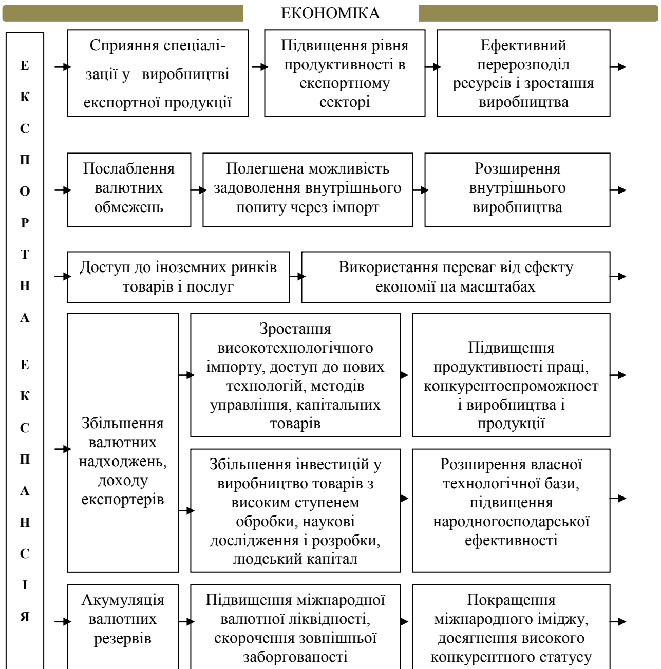
Рис. 1. Взаємозв'язок між експортною експансією та економічним зростанням країни

Характерною особливістю сучасного стану розвитку експортної діяльності регіонів України є глибокі зміни у співвідношенні динаміки можливостей загальнодержавного і регіонального рівнів експортної діяльності і відповідно посилення експортної активності регіонів. Отже, формування якісно нового рівня взаємовідносин України із світовим співтовариством потребує глибокого вивчення об'єктивних основ та обґрунтування практичних шляхів розгортання більш активної участі її регіонів в експортній діяльності, розширення їх повноважень в організації і розвитку цього процесу.