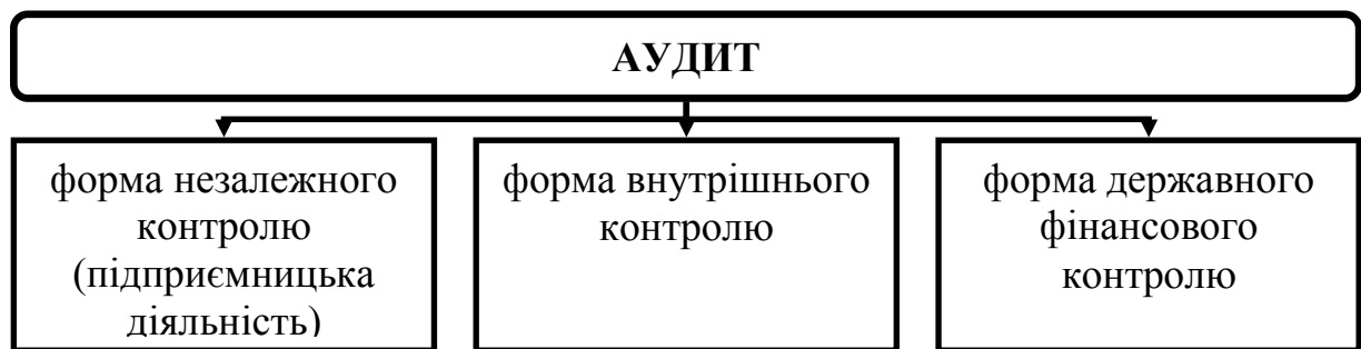
Рис. 1. Види аудиту

Питання організації і методики здійснення економічного контролю та аудиту взаємовідносин сільськогосподарських підприємств з бюджетом завжди викликали підвищену зацікавленість. Враховуючи це та вагоме місце аудиту в структурі сучасного економічного контролю, на нашу думку, є пріоритетним визначення задач аудиторів у відносинах аграрних товаровиробників з фінансовою системою стосовно фіксованого сільськогосподарського податку. Багатьма науковцями на сьогодні прийнята така класифікація сучасного вітчизняного аудиту (рис. 1.).