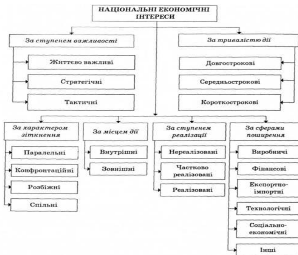
Рис. 2 Класифікація національних економічних інтересів

Для проведення аналітичної та прогностичної діяльності відповідні державні органи повинні визначати національні економічні інтереси, досліджувати їх взаємодію, співвідношення пріоритетності тощо. Можна застосовувати класифікацію національних економічних інтересів, що зображена на рис.2.