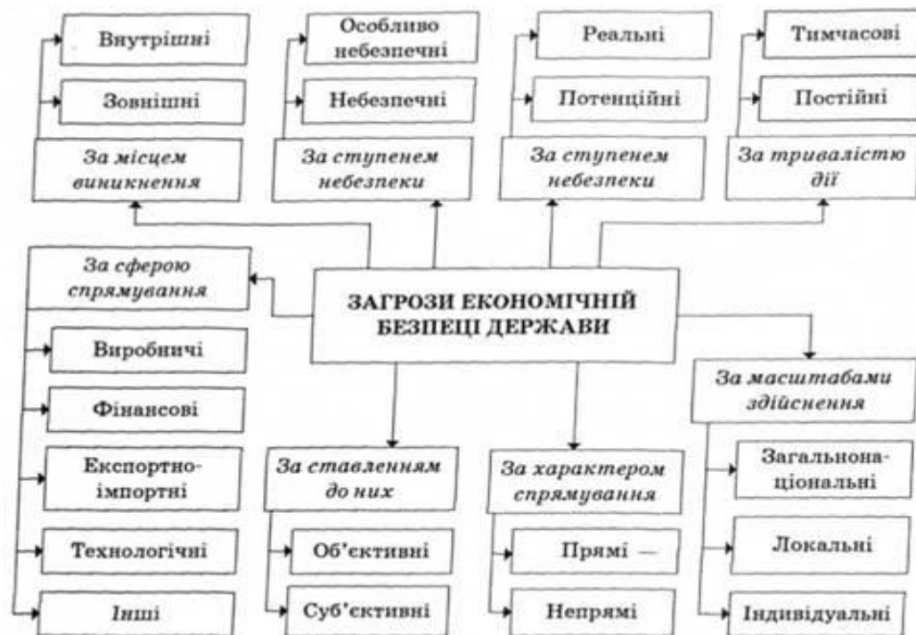
Рис. 3. Класифікація загроз економічній безпеці держави

Однак, аналогічно до того, як не існує єдино прийнятого визначення поняття "економічна безпека", так само немає визначеного переліку загроз національним економічним інтересам. Загрози економічній безпеці видозмінюються залежно від стану та рівня розвитку економічної системи і для кожної окремо взятої держави відрізняються характером та рівнем гостроти. В узагальненому вигляді класифікацію загроз економічній безпеці держави можна провести за такими параметрами (рис. 3).