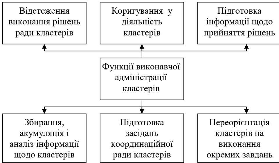
Рис.3. - Функції виконавчої адміністрації кластерів Миколаївської області

циклу робіт, технологій щодо ефективного виробництва тієї чи іншої продукції. Поточну роботу кластера здійснює виконавча адміністрація. Загальна схема управління кластерами Миколаївського регіону представлено на рисунку 4.