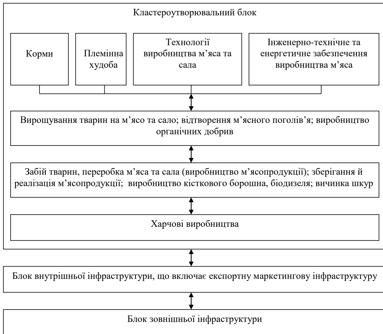
Рис.2. Модель експортного кластера м'ясопродукції Миколаївської області

найвпливовішим керівником одного з кластерів, або однієї із організацій (учасників) того чи іншого кластерного утворення. Допомагають йому в цій діяльності заступники – керівники кластерів за напрямками господарювання. Ця координаційна рада вирішує питання, що є характерними для кластерів регіону – актуальними для всієї аграрної сфери області, наприклад: яку, скільки, коли та де закупити сільгосптехніку, пально-мастильні матеріали тощо, а також щодо надання допомоги в соціально-культурній, духовній та рекреаційній сферах сільських територій регіону.