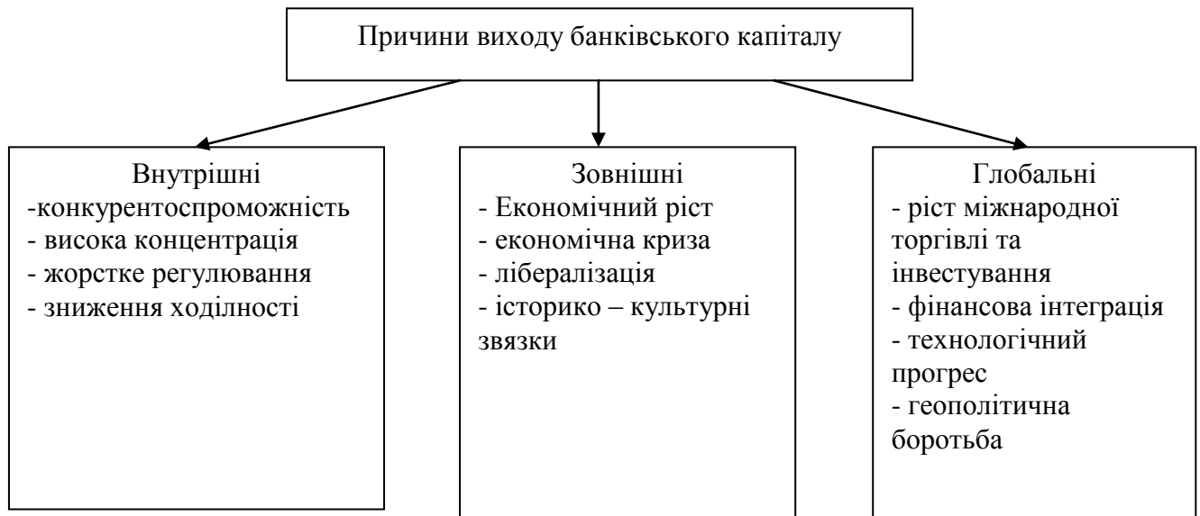
Рис. 1. Причини виходу банківського капіталу за національні межі

До внутрішніх причин виходу іноземного капіталу за кордон відносять вищу конкурентоспроможність іноземних банків, а також вищу концентрацію, нижчу маржу та суворіше регулювання банківських ринків країн-донорів.