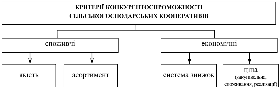
Рис. 1. Критерії оцінки конкурентоспроможності сільськогосподарських кооперативів

Дослідження сутності визначення конкурентоспроможності допомагають нам визначити конкурентоспроможність сільськогосподарських кооперативів як здатність змагатися однойменною продукцією з іншими сільськогосподарськими підприємствами за комплексом споживчих, виробничих і вартісних характеристик при однакових умовах товарного конкурентного середовища на ринку в масштабі району, області, держави. При існуючій конкуренції учасники ринку прагнуть досягти у порівнянні з конкурентом більш високий рівень конкурентоспроможності. Конкурентоспроможність сільськогосподарських кооперативів розглядають як здатність їх конкурувати на ринку за допомогою наступних характеристик: якісної продукції, ціни продукції, особливості продажу, максимальної задоволеності споживача. Оцінити рівень конкурентоспроможності можливо за допомогою низки критеріїв, які можна поділити на дві складові: економічні та споживчі ( рис. 1).