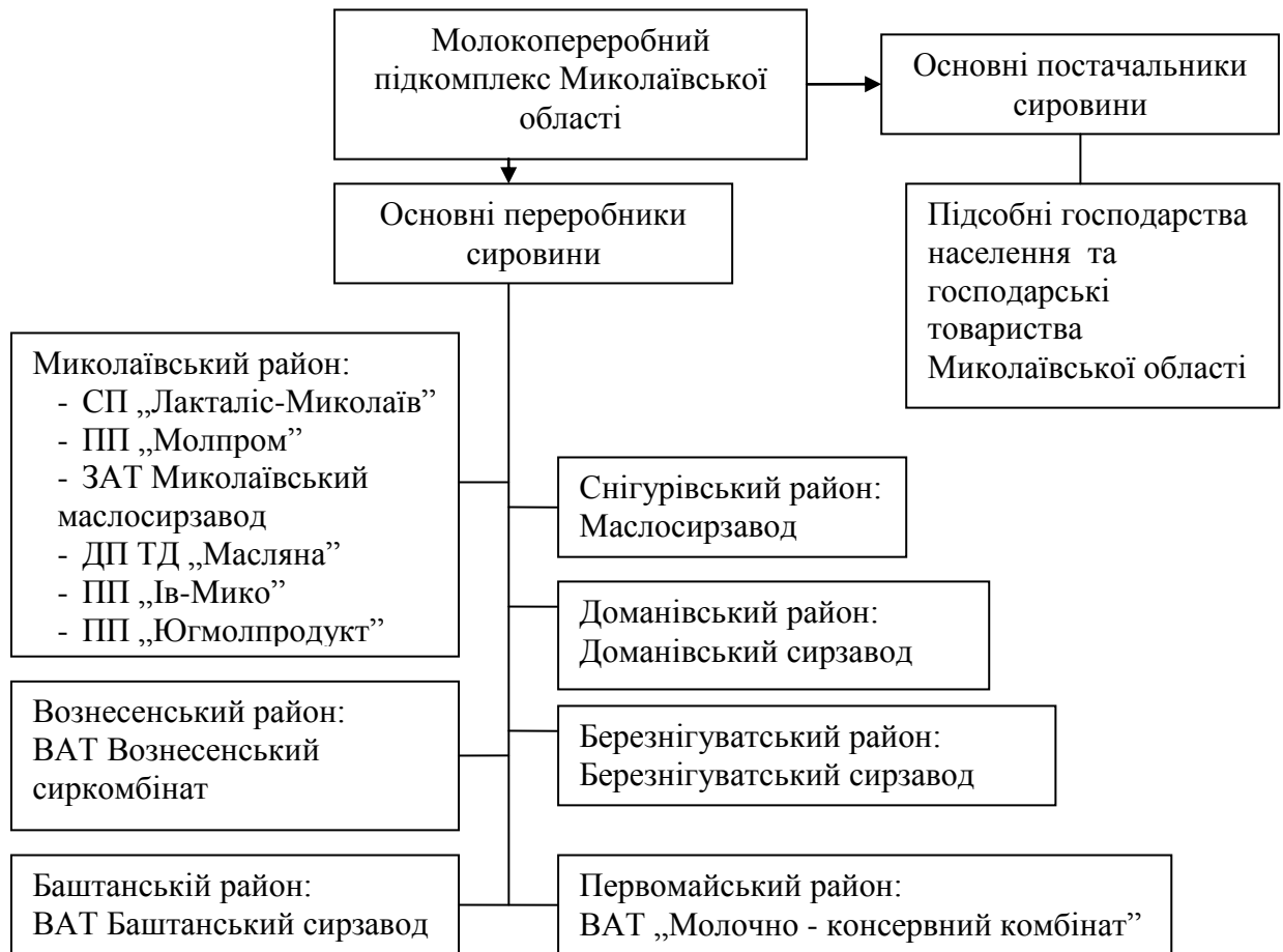
Рис.1. Структурна модель молокопродуктового підкомплексу Миколаївської області

На нашу думку, молоко відповідної якості та кількості може бути вироблене лише у фермерських формуваннях, кооперативах та сільськогосподарських підприємствах. Оскільки впровадження міжнародних стандартів якості його виробництва можливе лише при масштабному виробництві, бо вартість устаткування та впровадження високорентабельних технологій невідомо завдання для дрібних виробників, а тим паче підсобних господарств населення.