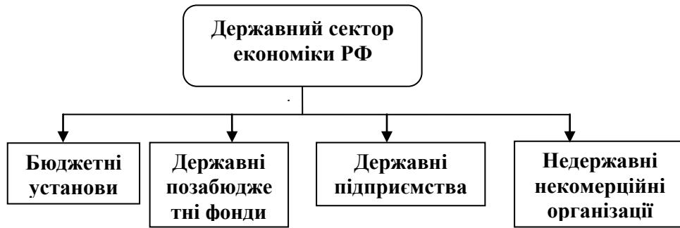
Рис. 2. Структура держсектору економіки Російської Федерації [Розроблено автором]

Зіставлення галузей російської промисловості за часткою державного сектору дозволяє згрупувати їх у 3 кластери. Перший включає галузі з високою часткою державного сектору (більше 1/3), а саме: поліграфічну й мікробіологічну промисловість. Другий кластер складається з галузей з помірною участю державного сектору (понад 10%, але не більше 1/3): машинобудування, кольорова металургія, медична, борошномельна й хімічна промисловість. Інші галузі попадають у третій кластер з низькою часткою державного сектора (менше 10%)[2, С.2-16].