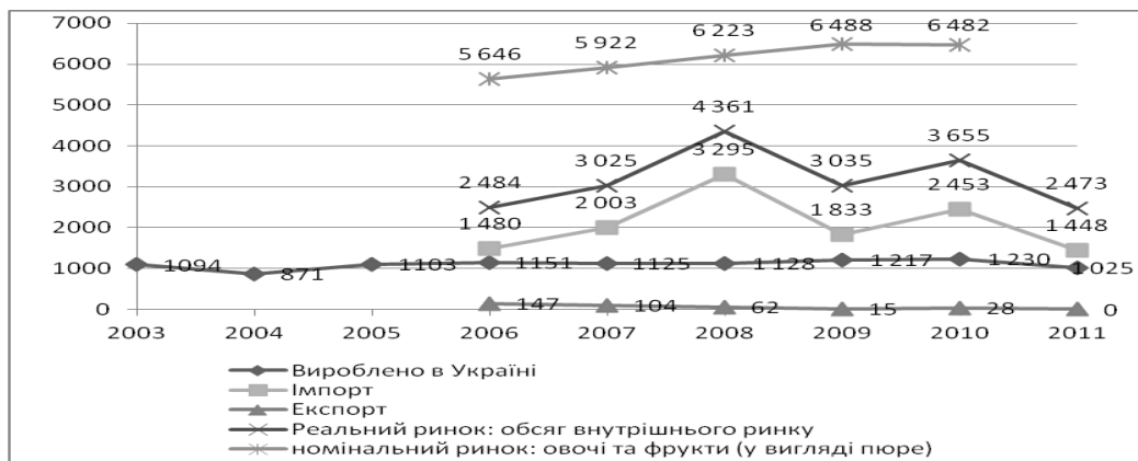
Рис.1. Обсяги внутрішнього ринку консервів плодоовочевих та фруктових у вигляді пюре.

Виклад основного матеріалу. Проведений аналіз ринку дитячого харчування (далі ДХ) показав нестабільність як у категорії «соки» так і у категорії «пюре». В обох категоріях частка, яку займають українські виробники у загальному ринку дуже низька. За підсумками 2011 р. обсяг виробництва ДХ вітчизняними виробниками найменший за період з 2006 р. Загальний стан ринку ДХ у категорії «пюре» наведено на рис. 1.