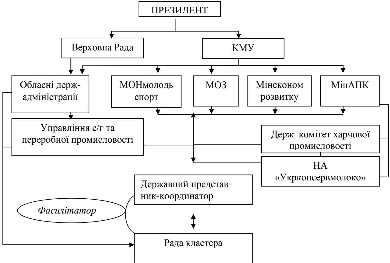
Рис.3. Схема взаємодії органів державної влади та кластеру з виробництва дитячого харчування.

організувати зустрічі із потенційними учасниками кластеру, де доведе до них переваги спільної праці. Особливо важливо це в галузі ДХ на плодоовочевій основі, бо рівень співпраці та бажання до неї між виробниками дуже низький, тому навряд вони самі проведуть цю роботу доки не зрозуміють переваг кластеризації. Роль фасилітатора неможливо недооцінювати, бо головне це зацікавити потенційних учасників у налагодженні діалогу та вигодах, яких можливо досягнути саме завдяки об'єднанню зусиль у деяких видах бізнес-процесів.