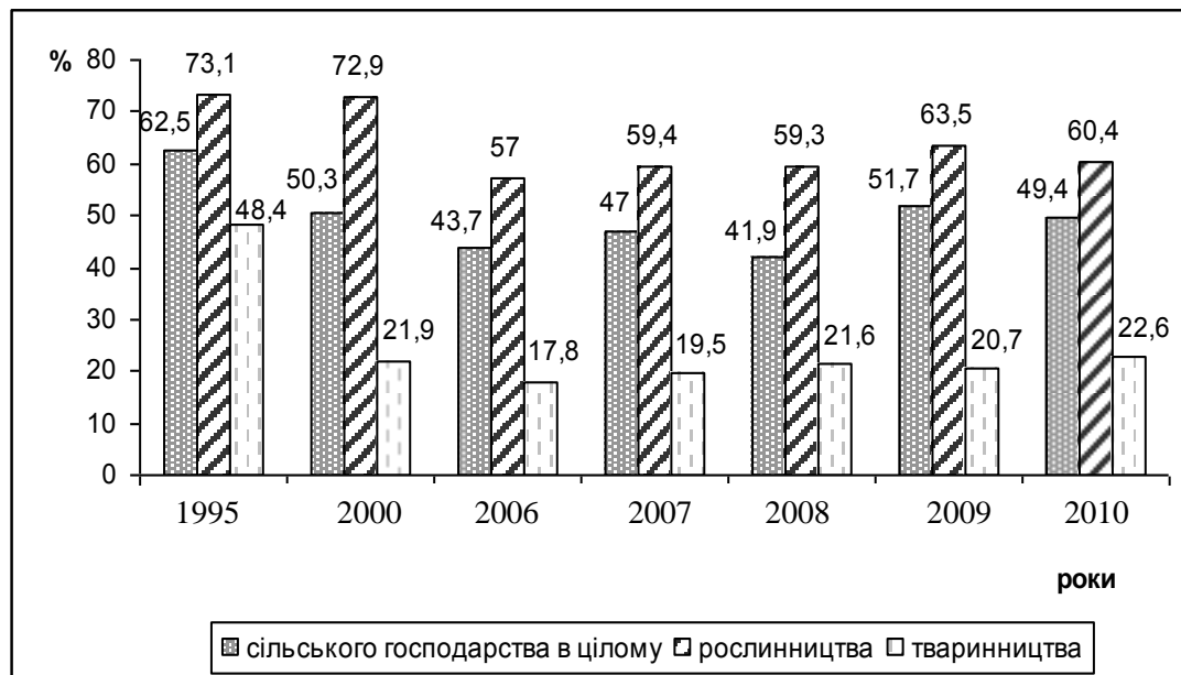
Рис.2. Питома вага сільськогосподарських підприємств в загальних обсягах виробництва аграрної продукції Миколаївської області

Наочне уявлення про характер змін в частці сільськогосподарських підприємств у вартості аграрної продукції в цілому, і в тому числі – рослинництва і тваринництва окремо надає рис.2. Наведена на ньому інформація свідчить, про помітне зниження ролі аграрних підприємств – як по всій сільськогосподарській продукції, так і рослинницькій і особливо – по тваринницькій.