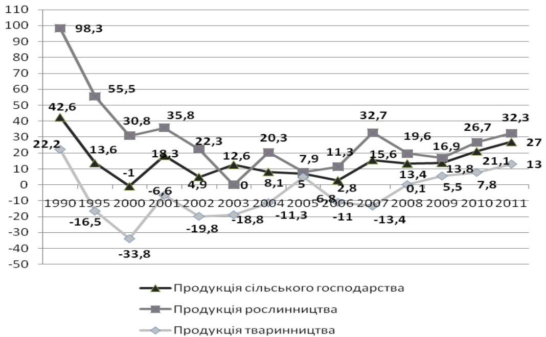
Рис. 1. Динаміка рентабельності (збитковості) сільськогосподарського виробництва у 1990-2011 рр., %

років був прибутковим, а відповідно мав можливість здійснювати просте відтворення. Але в умовах ринкової економіки цього недостатньо. Жорстка конкуренція об'єктивно змушує кожного товаровиробника здійснювати навіть не просто розширене відтворення, а на інтенсивно-інноваційних засадах.