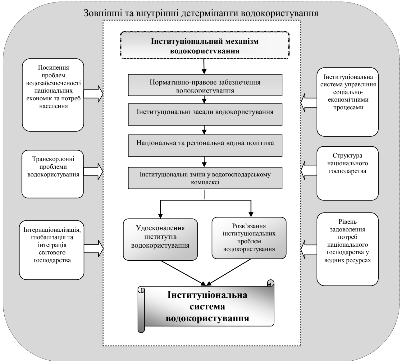
Рис. 2. Модель інституціонального середовища водокористування в ринкових умовах

продуктивних сил, систему спонукальних та заохочувальних заходів, які мають сприяти переходу національної економіки до використання маловодних та безводних технологій. Тому виникає необхідність формування інституціонального середовища водокористування, яке включатиме значно ширший спектр інституціональних одиниць, ніж система відносин, що сформувались у водогосподарському комплексі загалом та у водному господарстві зокрема (рис.2).