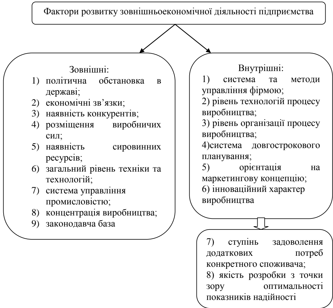
Рис.3. Система факторів розвитку зовнішньоекономічної діяльності [1]

Виникнення та інтенсивність прояву внутрішніх факторів безпосередньо залежить від діяльності аграрних підприємств в конкурентному середовищі, стану їх ресурсної бази, характеру організації системи стратегічного управління, системи загального менеджменту тощо. Виникнення та інтенсивність прояву зовнішніх факторів не залежить від діяльності аграрних підприємств і обумовлюється станом зовнішнього середовища. Фактори зовнішнього середовища є вкрай неоднорідними за джерелами свого походження, оскільки виступають проявом систем різного рівня.