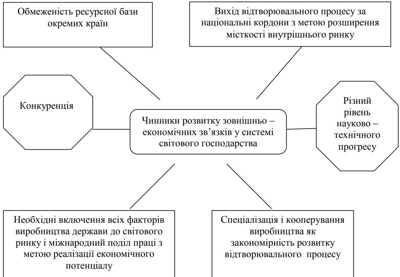
Рис.1. Чинники розвитку зовнішньоекономічних зв'язків [3]

Встановлені такі чинники розвитку зовнішньоекономічних зв'язків як: конкуренція; різний рівень науково-технічного прогресу; спеціалізація і кооперування виробництва; обмеженість ресурсної бази окремих країн; розширення місткості внутрішнього ринку (рис.1).