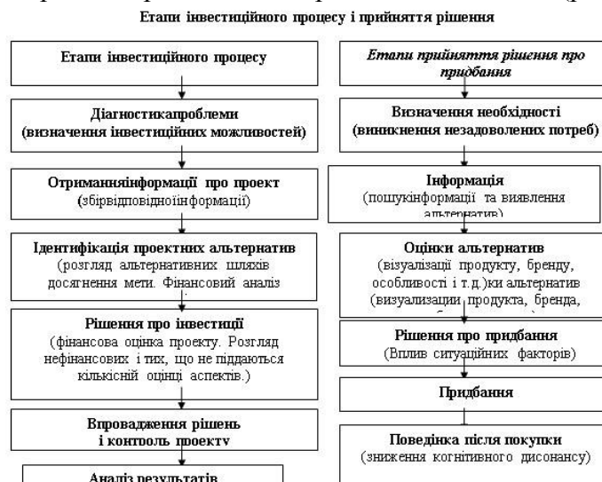
Рис. 1. Порівняння етапів інвестиційного процесу з етапами прийняття рішення про придбання

Інвестиційний процес передбачає конкретні логічні етапи: (рис. 1).