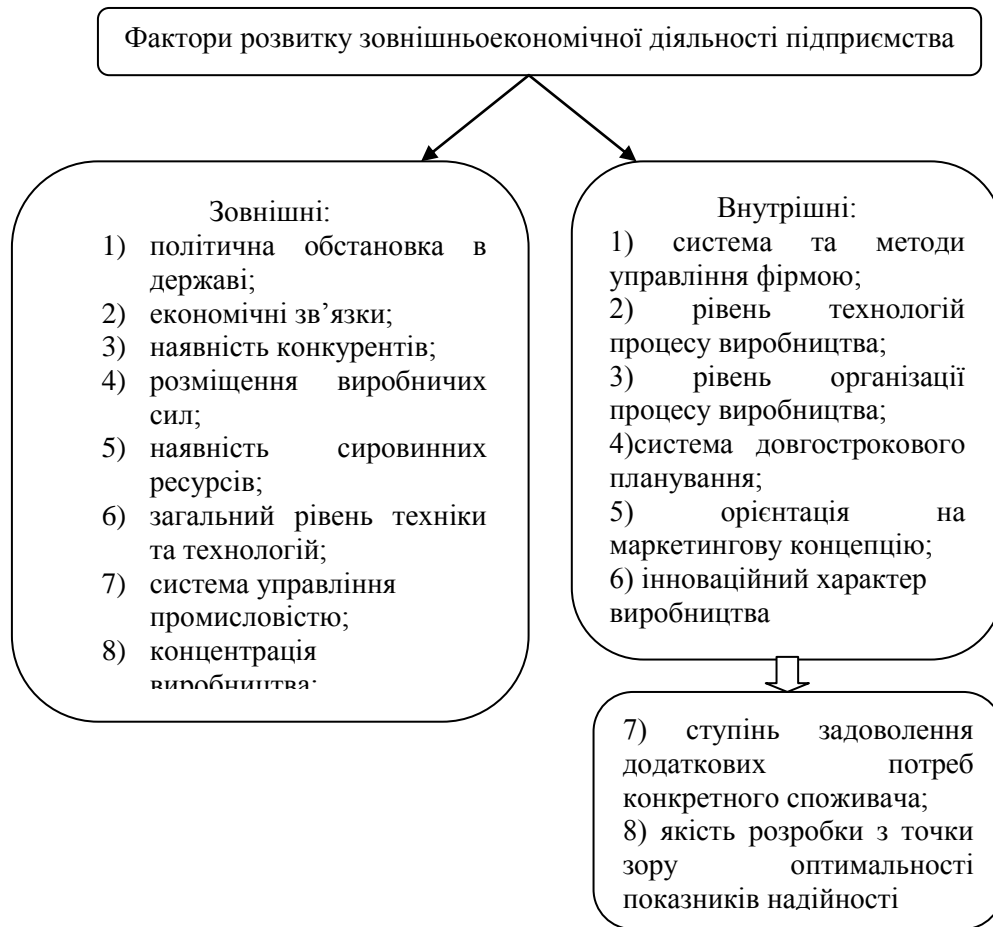
Рис.3. Система факторів розвитку зовнішньоекономічної діяльності [1]

Залежно від місця виникнення фактори розвитку зовнішньоекономічної діяльності підприємства поділяють на внутрішні та зовнішні (рис. 3).