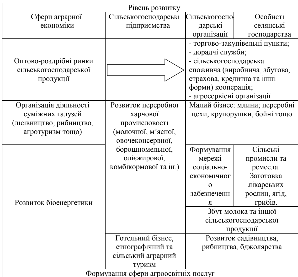
Рис. 2. Пріоритетні напрями диверсифікації сільськогосподарських підприємств, організацій та особистих селянських господарств

Для досягнення позитивних результатів розвитку сільського підприємництва логічно запропонувати пріоритетні напрями диверсифікації сільськогосподарських підприємств, організацій та господарств населення (рис. 2).