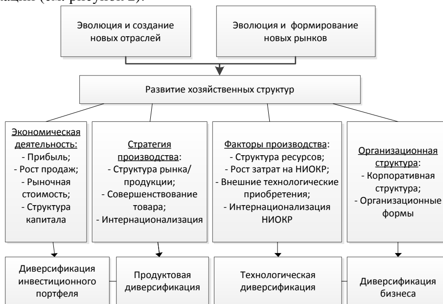
Рис. 1. Влияние диверсификации на развитие хозяйственных структур

системного и структурного анализа, любую хозяйственную структуру необходимо рассматривать как систему, состоящую из определенных взаимосвязанных элементов, которая сама является элементом более крупной системы. Скорости развития элементов системы отличаются и приводят к нарушению пропорций, для исследования и установления которых применяется структурный анализ. Диверсификация хозяйственных структур всегда приводит к изменениям в ее функциональных и структурных элементах. Это отражается на развитии хозяйственных структур через соответствующие направления диверсификации (см. рисунок 2):