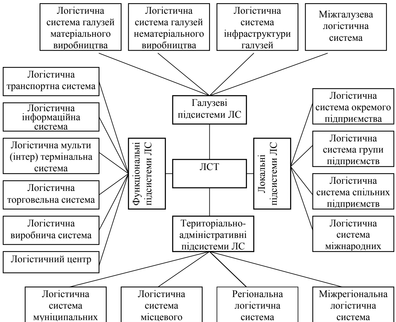
Рис. 2 Структурна модель логістичної системи руху товарів України

Висновки з даного дослідження і перспективи подальших розвідок у даному напрямі. Широке застосування логістики в практиці господарської діяльності пояснюється необхідністю скорочення часових інтервалів між придбанням сировини й поставкою товарів кінцевому споживачеві. Логістика дозволяє мінімізувати товарні запаси, а в ряді випадків взагалі відмовитися від їх використання, дозволяє істотно скоротити час доставки товарів, прискорює процес одержання інформації, підвищує рівень сервісу.